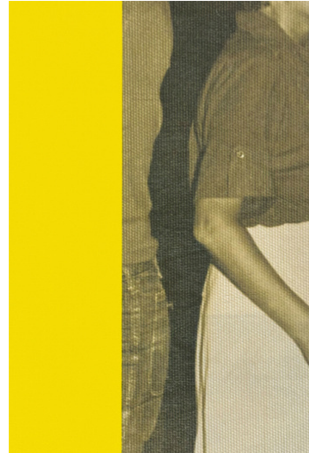
The Palette (Bar Dancing), 2024

Met Eulogy ontwikkelt Coers een gelaagde en intieme serie over familie, migratie en intergenerationele verhalen. Het project richt zich op stiltes, verlies en onuitgesproken geschiedenissen die binnen families blijven doorwerken en zo het heden mede vormgeven.