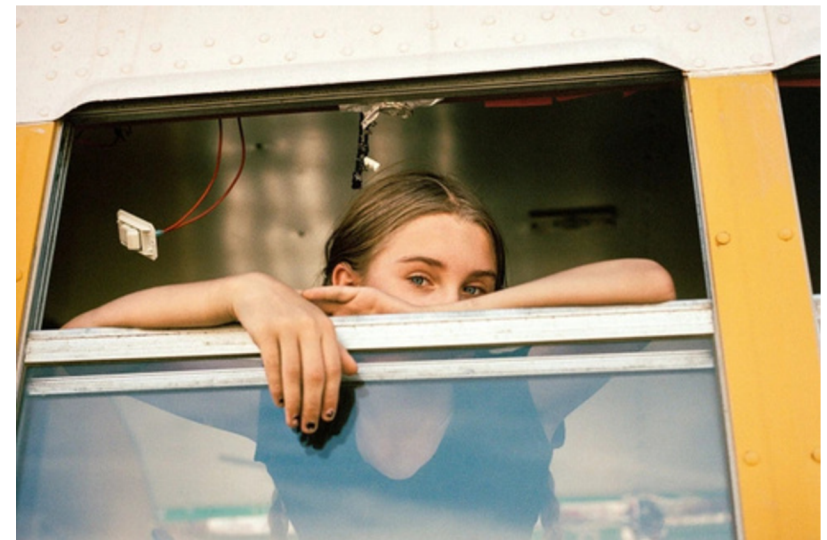
Lime Eyes, 2026; Bus Bedroom, 2023