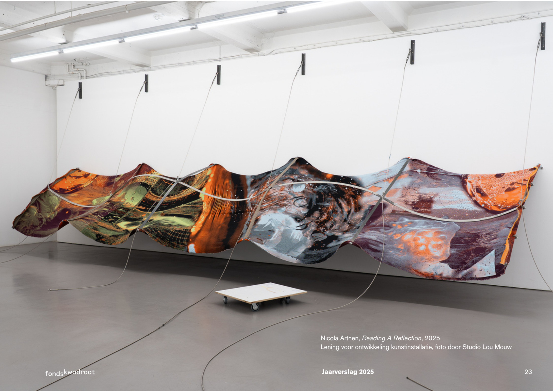
Nicola Arthen, Reading A Reflection , 2025 Lening voor ontwikkeling kunstinstallatie