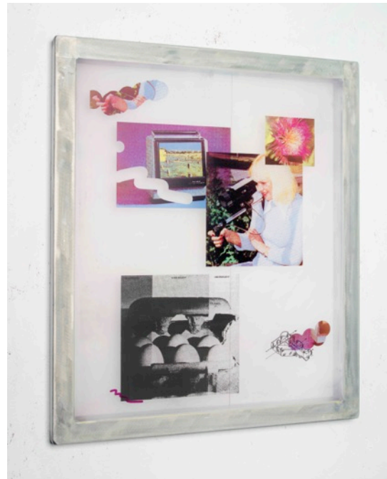
Foto links: Collage #1 detail, Manufactured Manual . Foto rechts: Collage #2, Manufactured Manual . Four colour exposure on silkscreen, 63 x 72 x 4 cm, aluminium silkscreen, plexiglas, wood, 2020