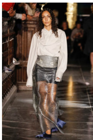
Ninamounah, FW20 Campaign (links) en 005 Complete Metamorphosis (rechts)