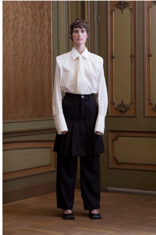
Ninamounah, COLLECTION 004 SHOW EVOLVE AROUND ME (links) en 005 Complete Metamorphosis (rechts)