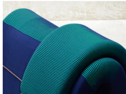
Links: Play! The importance of a child's imagination. Rechts: 3D Knitted Furniture.