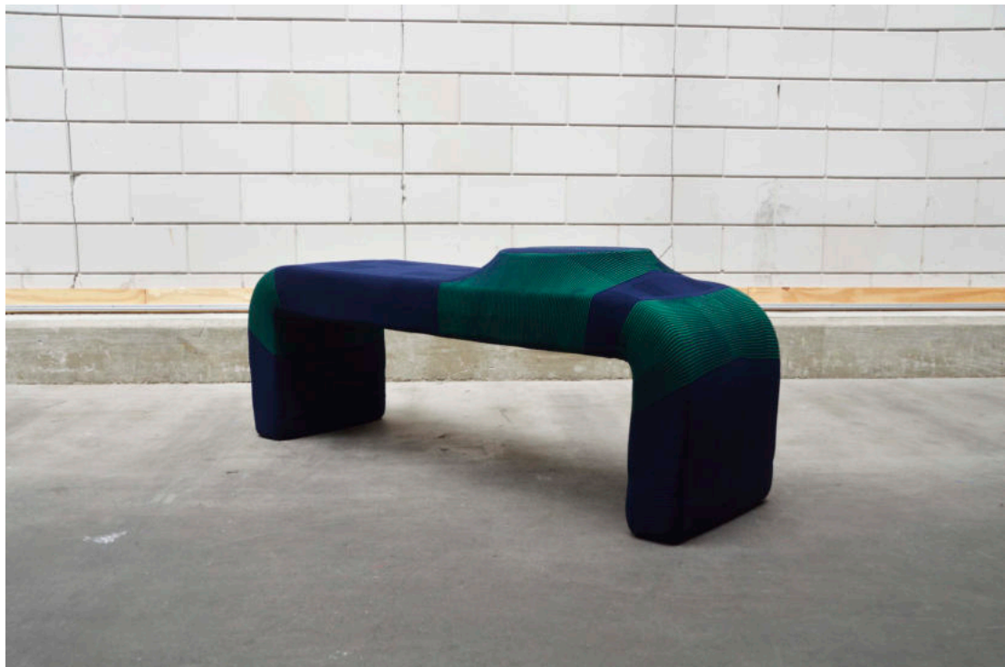
3D Knitted Furniture

Mijn werk is te zien op mijn website: www.skrabanja.com . Voor mijn gebreide meubels heb ik van het Stimuleringsfonds een subsidie gekregen om mee te doen aan de Salone Del Mobile in 2021 in Milaan.