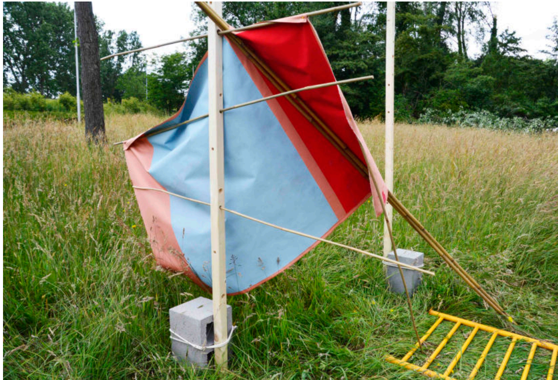
Installatie Play! The importance of a child's imagination.

Blijf spelen. Blijf met een open blik kijken, luisteren en praten en laat je verrassen door je intuïtie. Het afwisselen van intuïtie en analyseren is voor mij de ideale combinatie om te ontwerpen. Verbind je met de betrokkenen van je onderwerp en sta open voor de perspectieven van anderen, zodat je je blik verruimt. Bij veel jonge ontwerpers en kunstenaars zie ik dat ze de kwaliteit van hun eigen kunnen niet inzien. Zeker in de corona crisis verliezen mensen hun droom en hoop, dus daarom een shout-out naar vooral de jonge starters: blijf hoop houden en blijf bezig, de toekomst is dichtbij, je moet altijd net iets langer wachten dan dat je denkt.