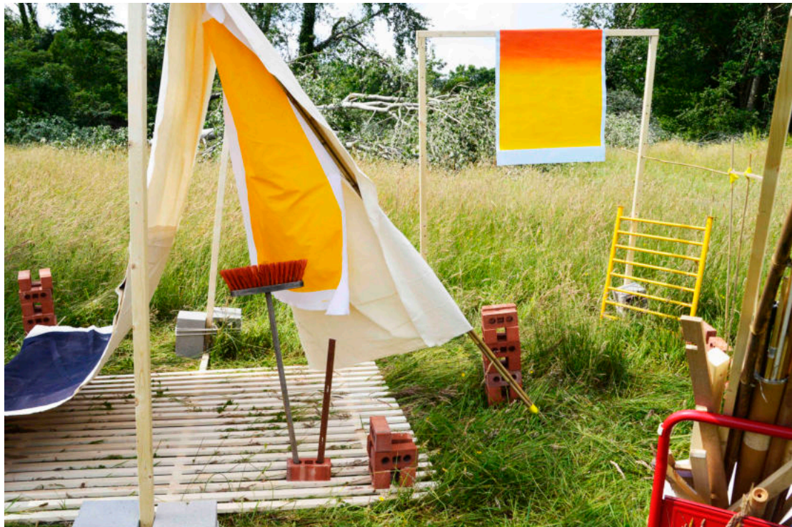
Installatie Play! The importance of a child's imagination.

Ik ben van mening dat er veel meer ruimte moet zijn om je neus achterna te lopen, te onderzoeken, dingen te ondervinden en eens hard je neus stoten. Om erachter te komen wat werkt en niet werkt, maar vooral om jezelf te blijven verrassen. Vrij spel is belangrijk voor kinderen en voor volwassenen, maar je begint bij kinderen, die van nature het vrije spel en verbeeldingskracht in zich hebben.