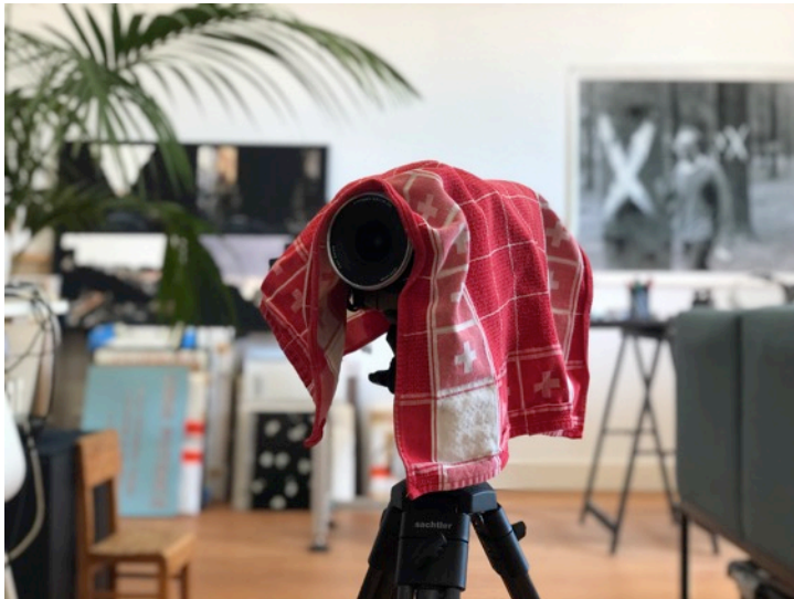
De met het bij Fonds Kwadraat geleende geld aangeschafte camera in afwachting van een project.

Voor de aanschaf van een nieuwe filmcamera. Ik heb samen met een voormalig student van het Sandberg Instituut – een performance kunstenaar die in Madrid woont – een scenario geschreven dat we in zijn geheel op IJburg wilden opnemen. Het was het verhaal van een beat-boksende chef-kok die een midlife crisis beleeft en het onderwerp van een documentaire wordt waarin hij zijn passie en inspiratie terug zou moeten vinden... Het was een zogenaamde screwball comedy. Maar dit soort projecten zijn in de huidige omstandigheden niet te maken zonder een aanzienlijk budget. Dus staat de camera nu onder een theedoek op een statief in mijn studio, te wachten totdat ik een project heb waarvoor hij wel kan worden ingezet. En daar werk ik ook aan; samen met een Britse schrijver ontwikkel ik een korte film die in twee dagen zou kunnen worden opgenomen. De hele gedachte van de aanschaf van deze camera was dat ik, net als in mijn laatste zelf gefinancierde speelfilm, onafhankelijk kon werken maar wel op een resolutie van cinema- en festivalkwaliteit. De vorige film die ik zo maakte was De Remigrant, over een man die na twintig jaar remigreert naar Nederland. Ik heb de film in zijn geheel bekostigd door de aanschaf van een camera. De rest was vrijwilligerswerk en heel veel geduld.