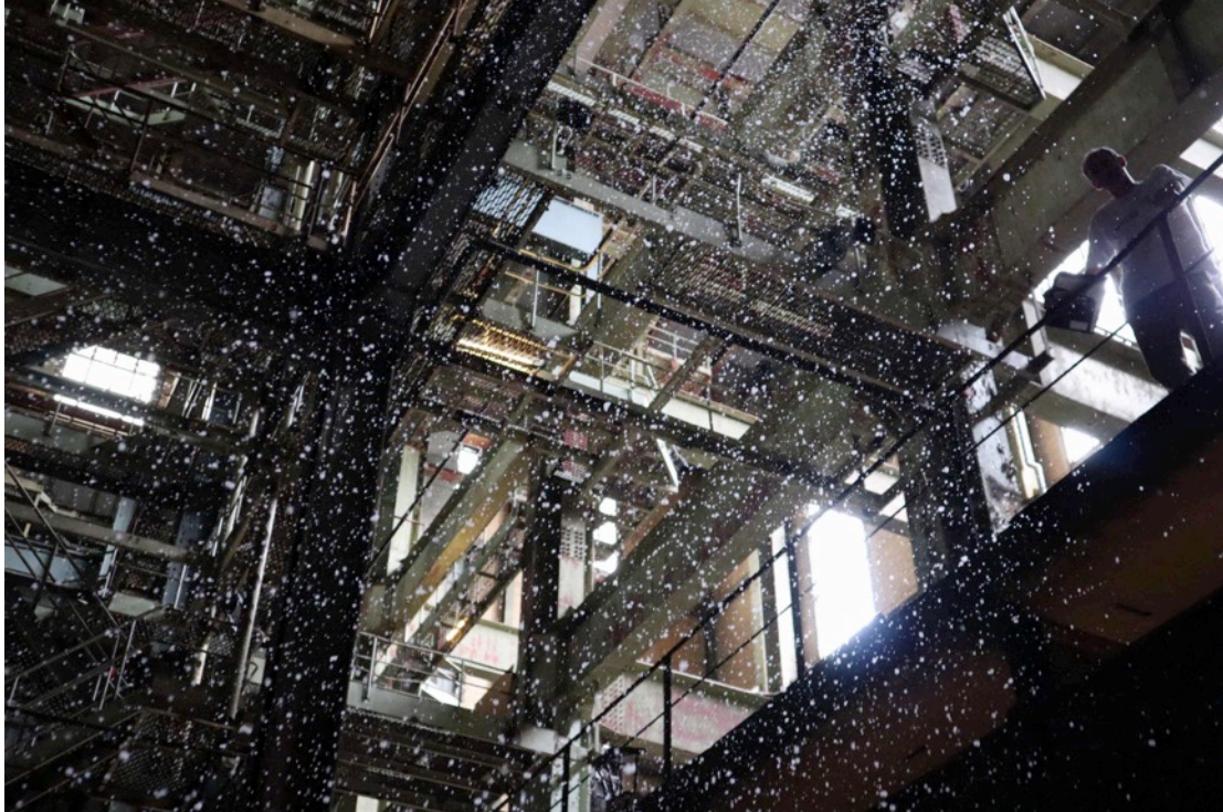
Test met sneeuwval in de Electriciteitsfabriek

Jazeker. Mijn websites www.gabriellester.com / www.polylester.com / www.lestarfilm.com . Maar ook hebben twee van mijn galleries programma's waar mijn werk online getoond wordt. Galerie Fons Welters, www.fonswelters.nl , en RyanLee Gallery, www.ryanleegallery.com , Check ook hun Facebook en Instagram accounts.