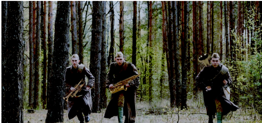
Fotomontage voor A Ringing in the Ears - een film over legermuzikanten

worden en eigenlijk niet de souplesse en de flexibiliteit hebben die je van een kunstenaar verwacht. Vaak spreek ik over het feit dat inspiratie wel degelijk bestaat, maar dat misschien een van de belangrijkste elementen van het maken van kunst, de vaardigheid is om in de wereld te kunnen herkennen wat bij jouw verhaal, stijl of persoonlijkheid hoort. Andere dingen die ik studenten en jonge kunstenaars vertel, is dat je gevoel en intuïtie moet ontwikkelen voor mogelijkheden en mensen. Een van de lastigste dingen om te leren. Het gebeurt jonge kunstenaars heel vaak dat ze veel tijd en energie steken in een belofte die nooit wordt nagekomen. Je moet dus naast kunnen herkennen in de wereld wat bij je verhaal past ook kunnen herkennen wie bij je verhaal past. En als laatste en dat is een heel optimistische: kunst is genereus. Je mag fouten maken en de mist in gaan, want als daartegenover goed werk staat, dan blijft dat overeind. En in dezelfde gedachte, werk dat je vandaag maakt kan misschien nog niet helemaal op de juiste manier worden begrepen en gewaardeerd, maar werk dat je over enkele jaren maakt kan dat werk van vandaag een nieuw perspectief geven. Zo is de context van je kunst eigenlijk altijd dynamisch en maken nieuwe werken je oudere werken betekenisvoller en rijker.