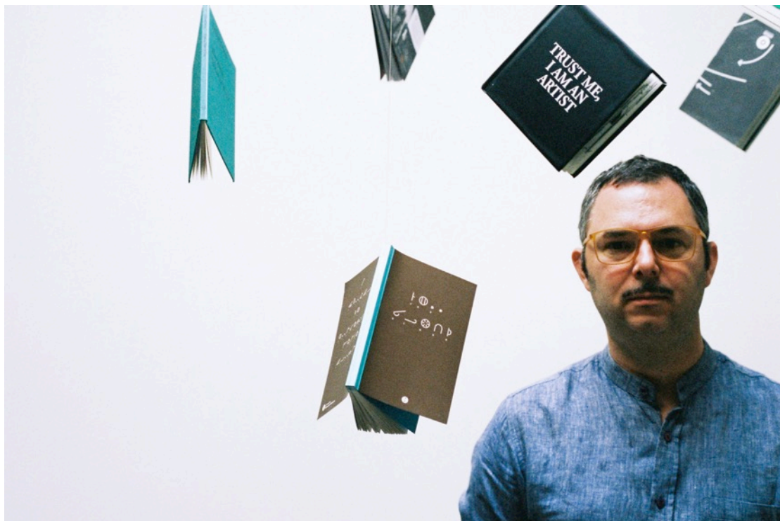
Gabriel Lester

Gabriel Lester (1972) is beeldend kunstenaar, filmregisseur, uitvinder en auteur. Zijn werk bestaat uit installaties, performances, film- en videokunst, fotografie en proza. Daarnaast realiseert hij in opdracht kunstprojecten in de openbare ruimte en geeft hij les. Zijn kunstwerken brengen zelden één expliciete boodschap of idee over, maar stellen manieren voor om je tot de wereld te verhouden. Lester's werk maakt deel uit van verschillende openbare en particuliere collecties, waaronder het Stedelijk Museum in Amsterdam, 798 Art Zone in Beijing, 21 Museum in Nashville en Museum Boijmans Van Beuningen in Rotterdam.