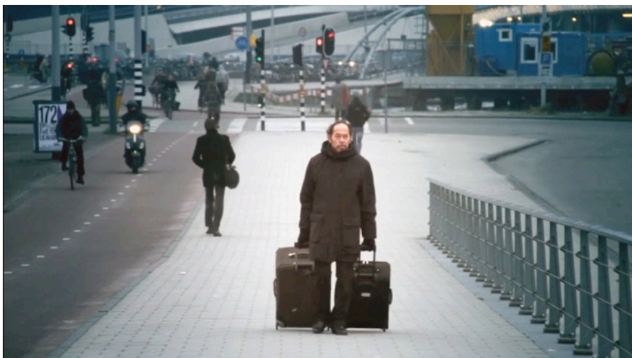
Still van De Remigrant 2019