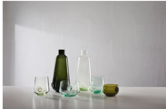
Links: To See a World in a Grain of Sand. Rechts: ZandGlas (beide foto's Blickfänger).