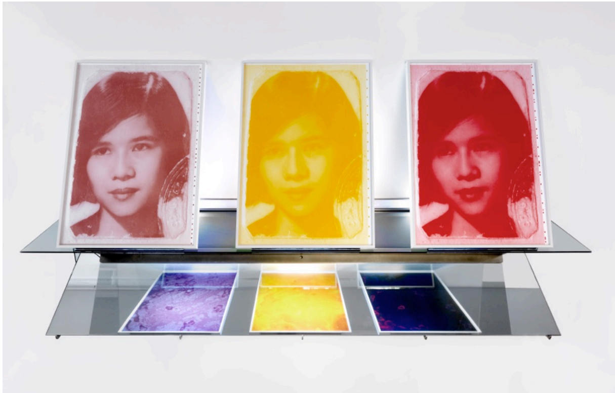
Nude, 2019, bij Atelier van Lieshout (AvL).

doka. Niet de donkerte van de klassieke doka, met al zijn kunstmatige herhaalbaarheid, maar de unieke donkerte van de nacht. Deze doka functioneert enkel wanneer de nacht het alledaagse overstijgt en de natuur bepalend is. Het oneindige. De openheid. Het kosmische. De blootstelling aan de nacht verfijnt en verhoogt de zintuigen tot een hogere staat van alertheid.