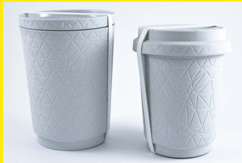
House of Thol Ontwerpers Project: Growing Decoration

De lening is mede mogelijk gemaakt door het Stimuleringsfonds Creatieve Industrie.