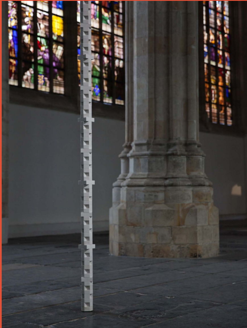
Stichting de Oude Kerk Beeldende Kunst