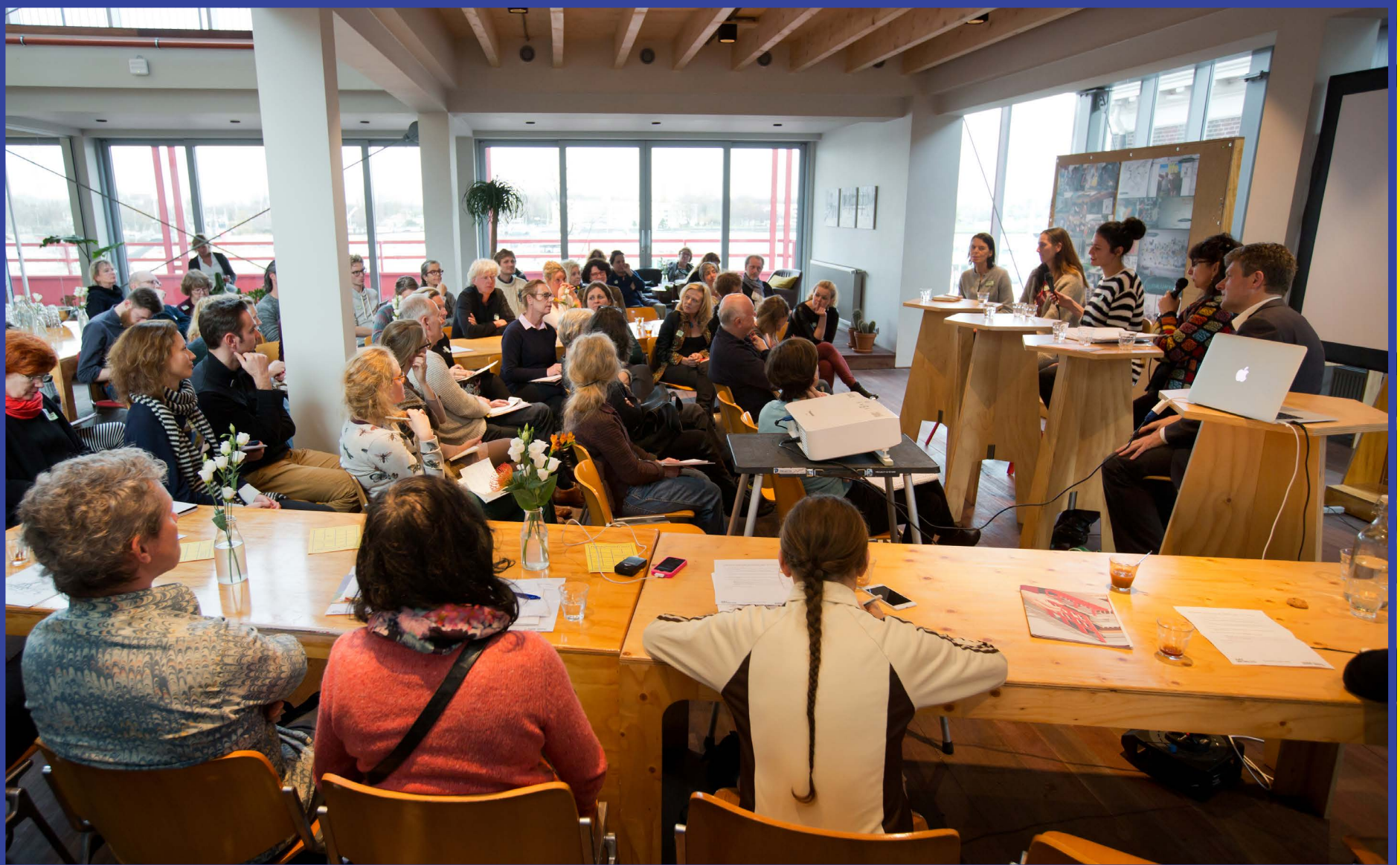
23 november: 'Experiment en subsidie, gaat dat samen?' in Spring House, samen met ArtWorlds, fotografie: Maarten van Haaff